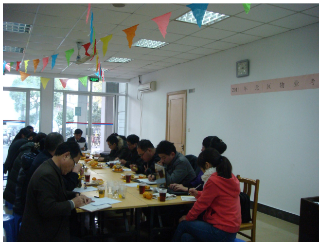
(学生园区办公室供稿)

本年度园区物业考评得分：北区东大物业 90.9 分，南区申城物业 89.3 分，西苑后勤公司 88.6 分，东区应用技术学院后勤中心 87.8 分。根据合同约定，各家公司均能全额获得考评专项金。